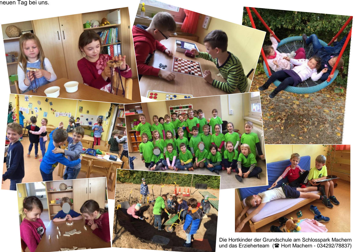
Die Hortkinder der Grundschule am Schlosspark Macher und das Erzieher team (☎ Hort Macher - 034292/78837)

Ein halbes Jahr Schul- und Hortalltag ist nun vorbei. Die Kinder der ersten Klassen haben sich super eingelebt und freuen sich auf jeden neuen Tag bei uns.