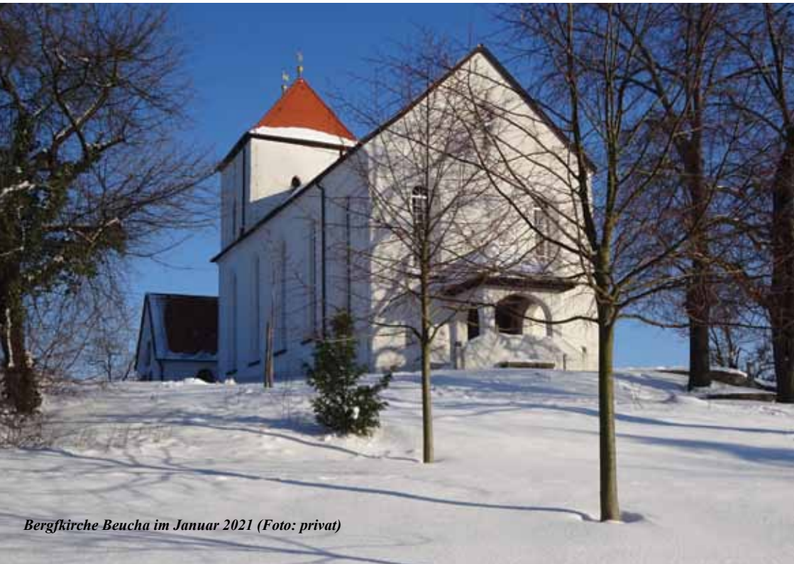
Bergkirche Beucha im Januar 2021