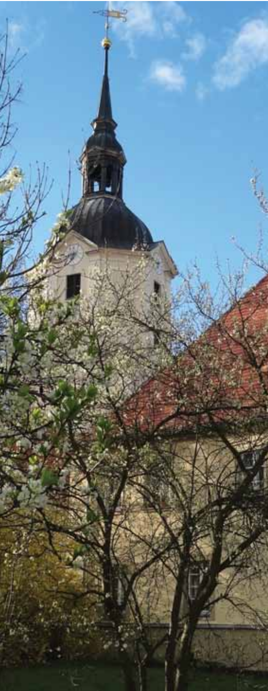
Kirche Brandis