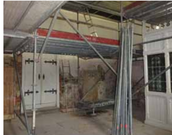
Bausituation in der Brauthalle Mitte Februar

Bei der Innensanierung wurden inzwischen viele Vorhaben abgeschlossen. Mitunter waren die Arbeiten kompliziert und unerwartete Probleme waren zu lösen. Glücklicherweise konnten ab Januar auch in der Brauthalle die Arbeiten beginnen. Durch die „Kälte-Wochen“ im Februar und neue Farbfunde an der Decke haben sich die Arbeiten verzögert und werden zu Ostern nicht abgeschlossen sein. Einen Eindruck von der sicher ungewohnten Farbgestaltung dieses schönen Raumes können die Besucher aber schon gewinnen. Ist das Kirchenschiff in hellocker nun wieder stärker barock geprägt, so erhält die Brauthalle die wiederentdeckten Farben von 1895. Vor etwa 125 Jahren wurden in die Brauthalle Holzverkleidung und Bleiverglasung eingebaut und der Raum in Rosé, Hellgrün und Dunkelgrün gestaltet. Im April und Mai werden noch die restlichen Tischler- und Malerarbeiten erfolgen und auch die Beschallungsanlage für eine bessere Verständlichkeit wird noch eingebaut.