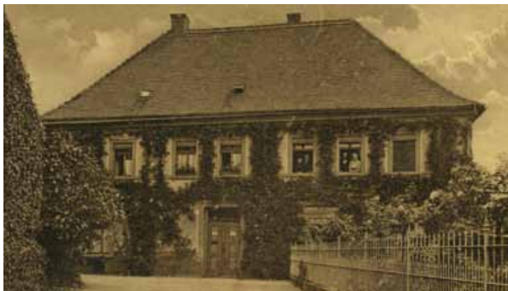
Pfarrhaus Brandis um 1900