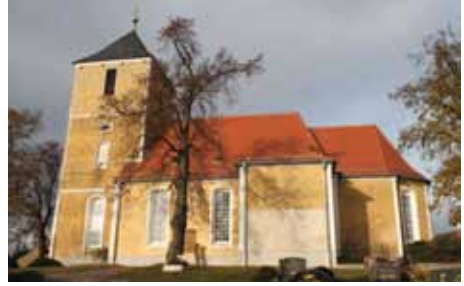
Kirche Polenz